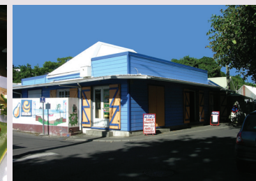
Boutique sur le front de mer de Terre Sainte