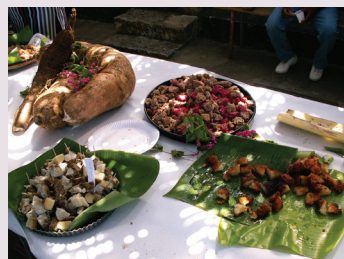
Mets lontan à Cafrine Grands-Bois.

Infos au 02 62 32 60 30 (contrat ville de Terre Sainte)