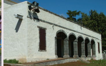
Ancien dépôt de rhum de Pierrefonds (actuel théâtre)