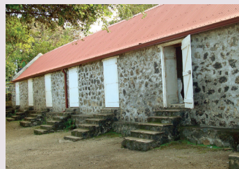
Ancien hôpital de Grands-Bois