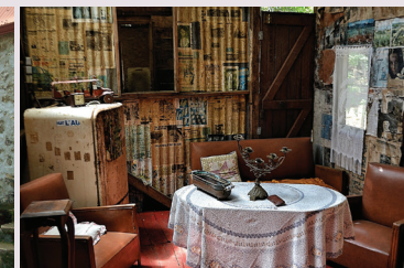
Intérieur case créole reconstitué au Vieux Domaine