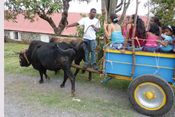
Promenade en charrette bœufs à Grands-Bois

Infos : 0262 32 60 20 (Contrat de Ville de Grands-Bois)